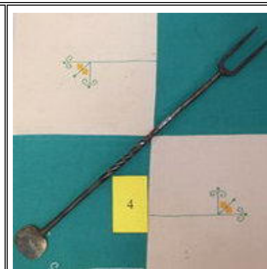
4. VAŘEČKA PŘI ZABIJAČCE