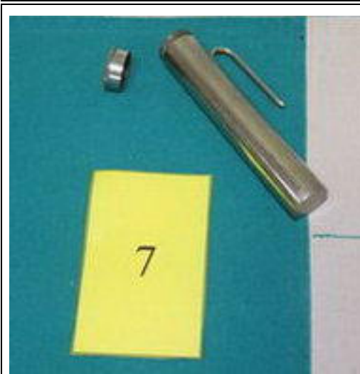
7. OHŘÍVÁČEK PIVA