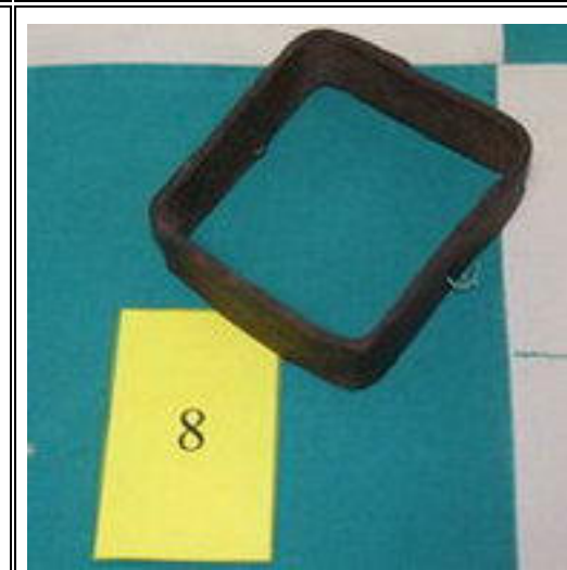
8. PODSTAVEC POD HORKÝ PLECH