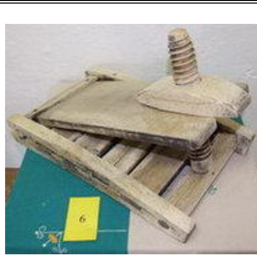
6. LIS NA TVAROH