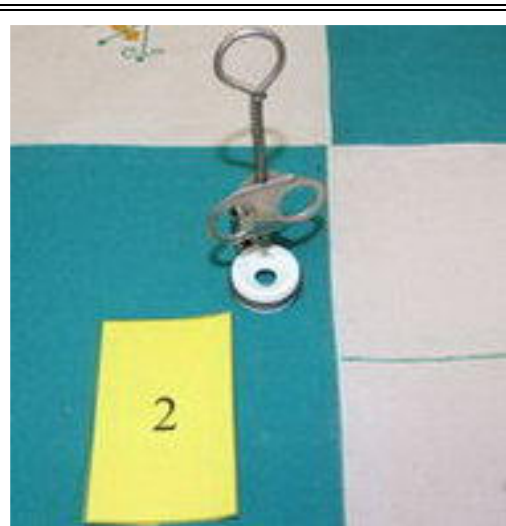
2. ODPECKOVAČ TŘEŠNÍ