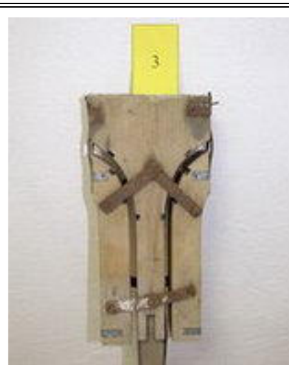
3. TVAROVAČ LYŽÍ