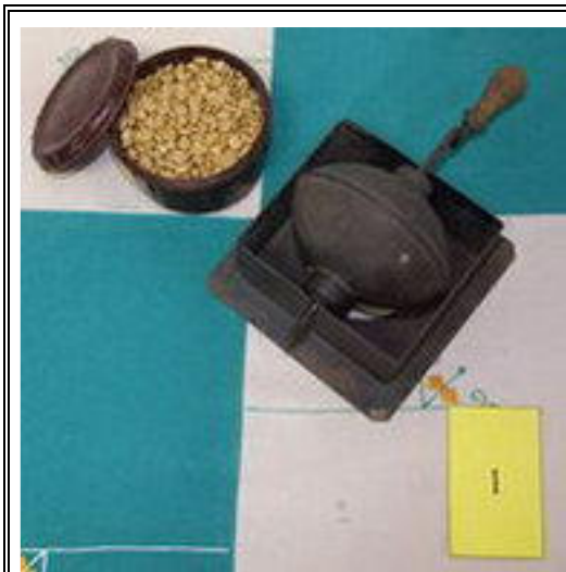
1. PRAŽIČ ZELENÉ KÁVY

poznávané na výstavě „Z truhlic našich babiček“